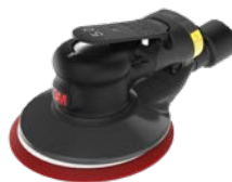
3M Xtract™ Pneumatyczne szlifierki mimośrodowe

Do szlifowania drewna, metalu i kompozytów dyski na podkładzie z siatki 3M Xtract™ oferują wiodącą w branży szybkość szlifowania i pomagają utrzymać czystsze środowisko pracy, co skutkuje lepszą wydajnością i lepszymi wynikami. Dostępne także w rolce: Dyski na podkładzie z siatki w rolce 3M™ Cubitron™.