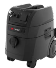
3M Xtract™ Mobilna jednostka do odsysu pyłu